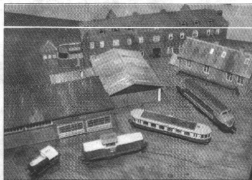
Velkendte bygninger 87 størrelser mindre end normalt...