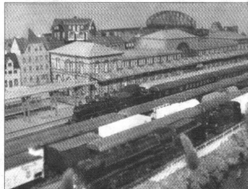
Dette er en kopi af banegården i Bonn, Tyskland. Modelbaneklubben har dog givet den et dansk navn, Helsingbro.