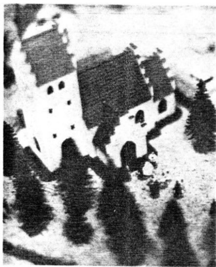
At lege med modeltog er også at bygge huse og lave landskaber. Et brudepar er på vej ud af kirken...

Interessen for at lege med modeltog er stor i Holstebro - nu vil man lave en klub